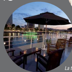
La terrasse du ponton.