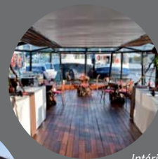
Intérieur de la péniche.

Après le dîner, un DJ nous accompagnera, sur le ponton à quai, pour poursuivre cette soirée festive !